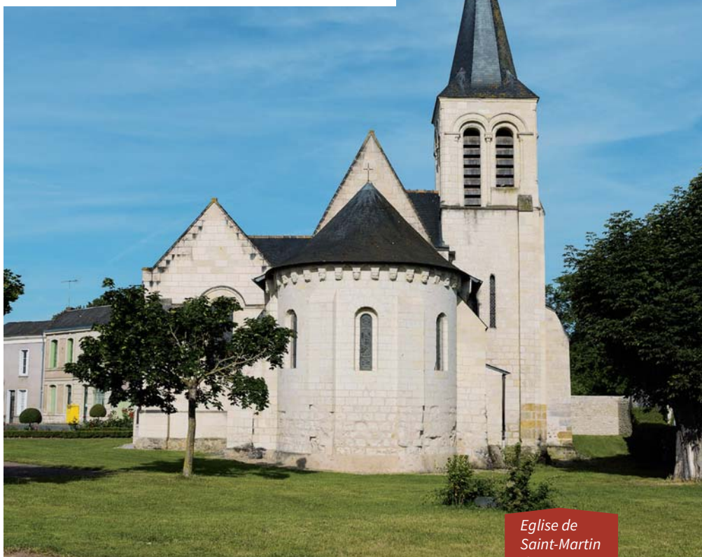
Eglise de Saint-Martin de Sanzay

Plus près dans le temps, le chemin de Croix peint par Abel Pineau parle aux contemporains. Cet artiste né à Angers, diplômé de l'École Supérieure des Beaux-Arts de Paris, a épousé en 1939 la propriétaire du château du Bois de Sanzay où il séjourne très régulièrement. C'est donc tout naturellement qu'il a puisé son inspiration