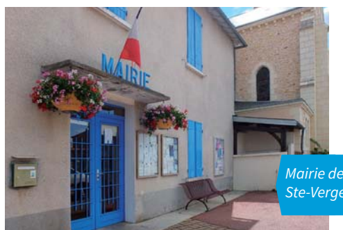
Mairie de Ste-Verge